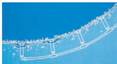
Bez zpětného ventilu SAM

Zpětný ventil Seal-A-Matic™ (SAM) brání vytékání zbytkové vody postřikovačem.