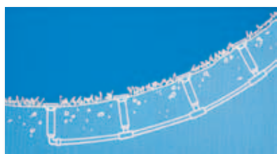
Se zpětným ventilem SAM